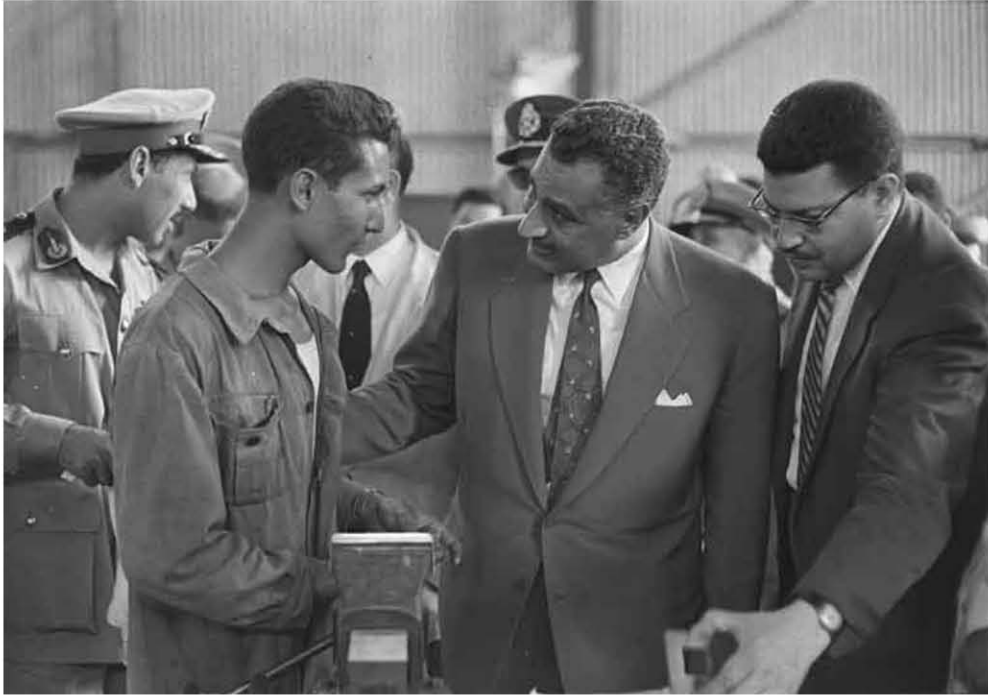
زيارة مصنع إنتاج الطائرات ١٩٥٩/٦/٩